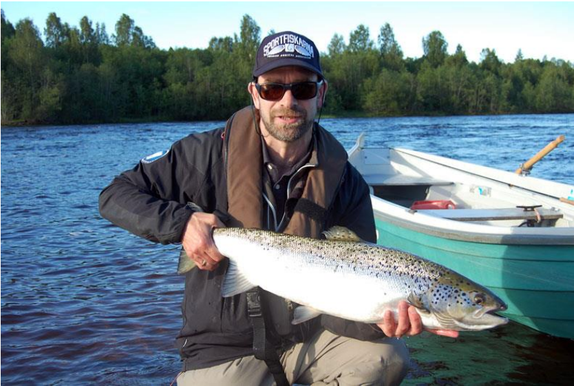
Infokvällarnas tema är fisket i Vänern, Klarälven och Gullspångsälven